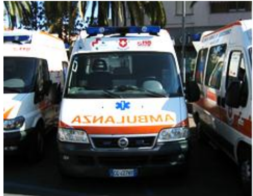
Fiat Ducato: donato alla Croce Azzurra di Carloforte