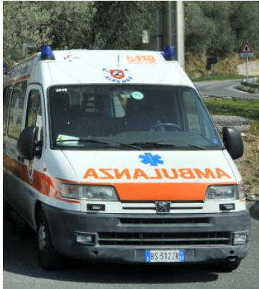
Peugeot Boxer: donato all'Associazione Gruppo Fratres di Villalba in Sicilia

E ancora, ma sicuramente non ultima, in occasione dei 100 anni della nostra Croce Bianca, consegneremo le chiavi di un nostro mezzo, un Peugeot Boxer, all'Associazione Gruppo Fratres "Gianni Messina" di Villalba, in Sicilia, per poterli aiutare nella loro attività di soccorso e aiuto al prossimo.