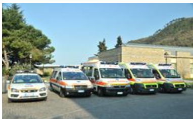
Il responsabile della P.A. Croce Bianca Albenga Sezione di Villanova