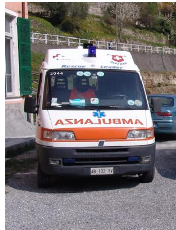
Fiat Ducato 2000: donato in Burundi alla Missione S. Francesco Kayongozi