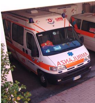
Citroen Jumper: donato all'Associazione Volontari Alto Aterno Onlus all'Aquila